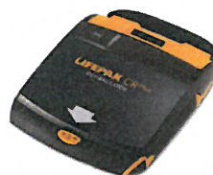
Prisvärd! LIFEPAK CR Plus