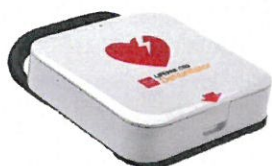
Senaste tekniken! LIFEPAK CR2